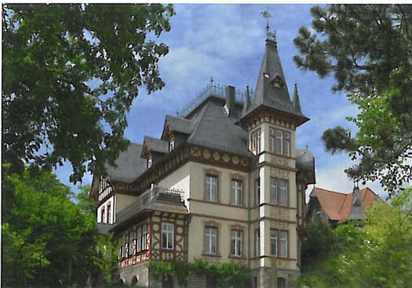
Abb. 7: Fulda, Villa Wegener

von Stockhausen an die Gemeinschaft Altenschlirf, eine Einrichtung der Behindertenhilfe, deren Mitglieder sich vor allem um die laufende Parkpflege kümmern und auch partiell an den Denkmalpflegemaßnahmen beteiligt waren. Aber nicht nur die Gemeinschaft nutzt den Schlosspark, sondern er ist öffentlich zugänglich und von den Vorzügen der sehr gut erhaltenen Gartenanlage können alle Menschen profitieren.