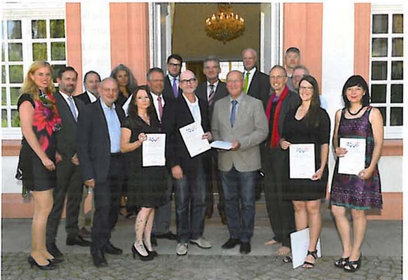
Abb. 10: Die Preisträgerinnen und Preisträger