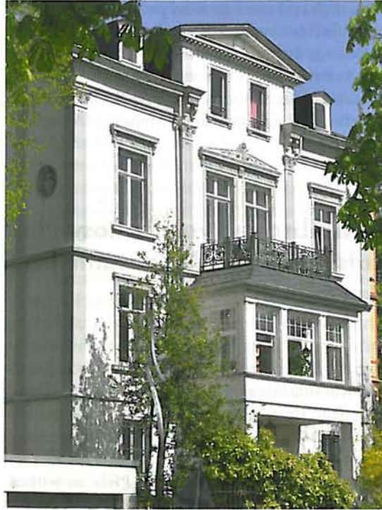
Abb. 8: Wiesbaden, Villa Marienquelle