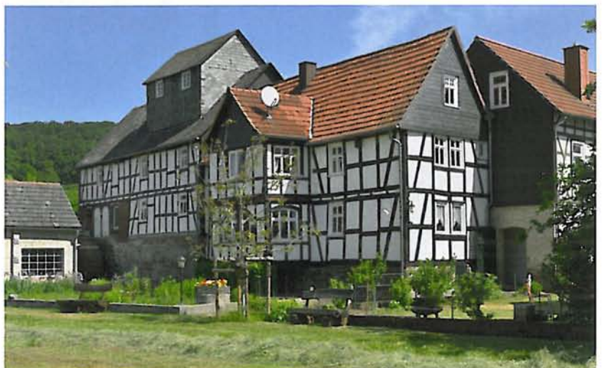
Abb. 5: Lohra-Damm, Mühle Damm

6. Eine Urkunde ging zusammen mit 4000,- Euro Geldpreis an die Michael-Stiftung , die durch die ebenfalls in der Ehrung genannte Software AG-Stiftung maßgeblich gefördert wurde. Gemeinsam haben sie die Instandsetzung und Wiederherstellung des hauptsächlich aus dem späten 18. Jahrhundert