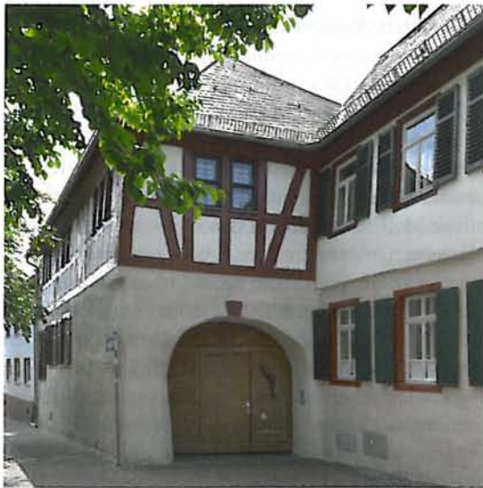
Abb. 9: Geisenheim, ehemaliger Winzerhof