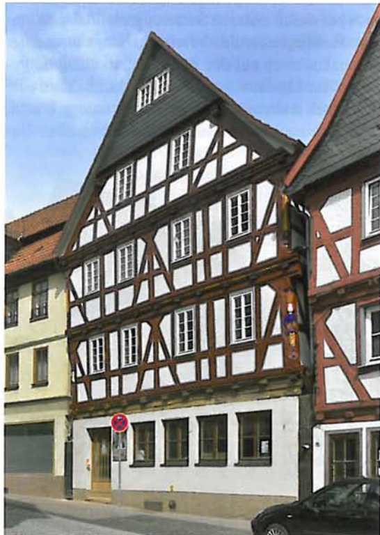
Abb. 3: Alsfeld, Wohnhaus Hersfelder Straße 24

Hoffassade der Fachwerkscheune von 1809 zeigt Zierelemente vor allem an den in hervorragender Weise bewahrten Scheunentoren, die durch gleichwohl konstruktiv notwendige, die Verbretterung zusammenhaltende, kreuzförmige Verstreben gegliedert werden. Durch die Neuerrichtung von Stall- und Wirtschaftsgebäude erhielt der Hof 1954, ergänzt durch die straßenseitige Natursteinmauer, sein endgültiges Erscheinungsbild. Mit viel Fingerspitzengefühl wurden Sanierungsmaßnahmen in jüngerer Zeit ausgeführt, die äußerste Rücksicht auf historische Bausubstanz nahmen. Viele Maßnahmen erfolgten in Eigenleistung. So konnte auch das eindrucksvolle Äußere erhalten werden, das ganz wesentlich für den städtebaulichen Zusammenhang der historischen Dorfanlage von Schenklengsfeld-Hilmes geblieben ist.