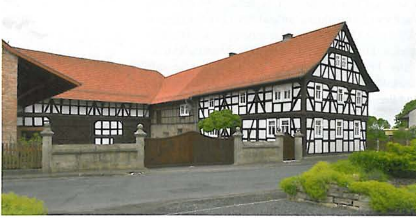
Abb. 2: Schenklengsfeld-Hilmes, Engers-Hof

merkwürdig sind auch die intensiven Bemühungen des Vereins um die Denkmalvermittlung.