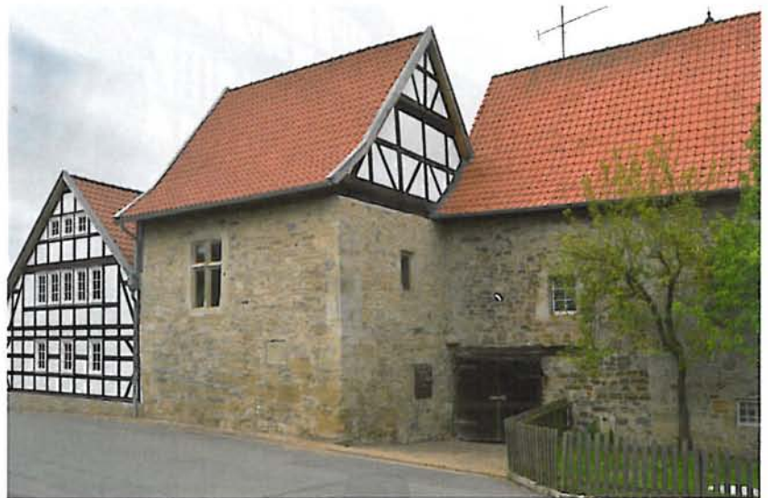
Abb. 1: Diemelsee-Flechtdorf, Kloster Flechtdorf, Abtshaus