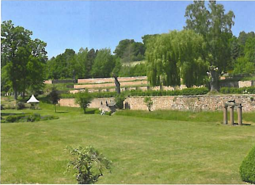
Abb. 6: Herbstein-Stockhausen, Park von Schloss Stockhausen

stammenden Barockgartens von Schloss Stockhausen ermöglicht (Abb. 6). Dieser besteht aus drei voneinander durch Stützmauern getrennten Terrassen, die jeweils dem Anbau von Nutzpflanzen oder eher der Repräsentation dienen. Auch ein kleiner, daran angeschlossener englischer Landschaftsgarten stammt aus derselben Zeit, ebenso der Brunnen, mehrere Putten und Vasen. Nach Norden hin fällt die Konchenmauer auf, die neben einigen anderen Stütz- und Umfassungsmauern in jüngster Vergangenheit die meiste denkmalpflegerische Zuwendung beanspruchte. Nach plötzlichen Einstürzen mussten Mauerbereiche notgesichert und sehr aufwändig wieder instand gesetzt sowie neu verfugt werden. Auf der Grundlage eines gartendenkmalpflegerischen Gesamtkonzepts wurden störende Pflanzen und bauliche Anlagen wie Schuppen und Gewächshäuser entfernt. Man nahm im Gegenzug Neupflanzungen vor und restaurierte Tore, Zäune, Brunnen, Skulpturen und das zauberhafte Borkenhäuschen. Die Michael-Stiftung verpachtet die Schlossanlage